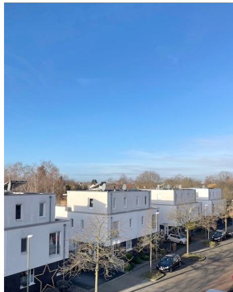
Balkon / Ausblick