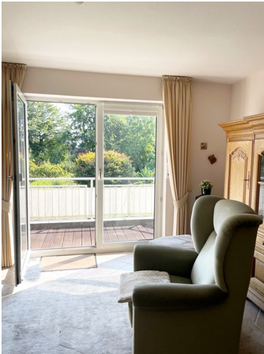
Ausgang auf den Balkon