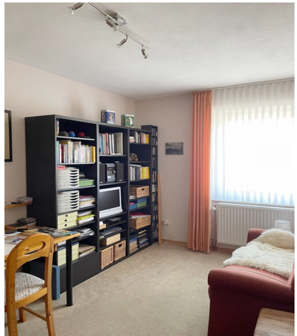
Kinder- oder Arbeitszimmer