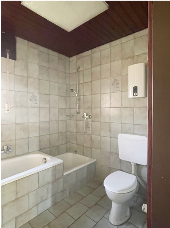
Badezimmer mit Tageslicht