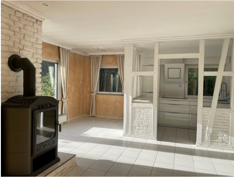
offene Küche mit Essbereich