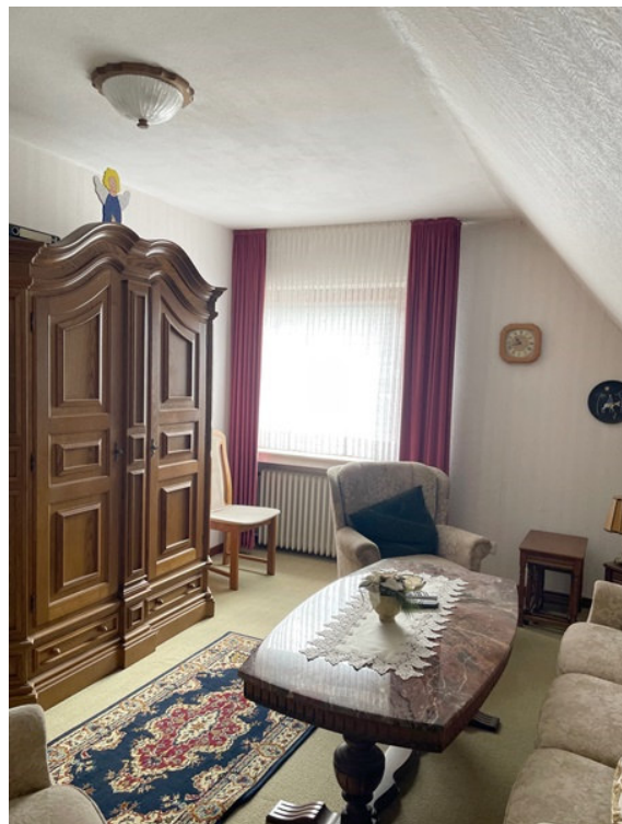
Kinder-/ oder Arbeitszimmer