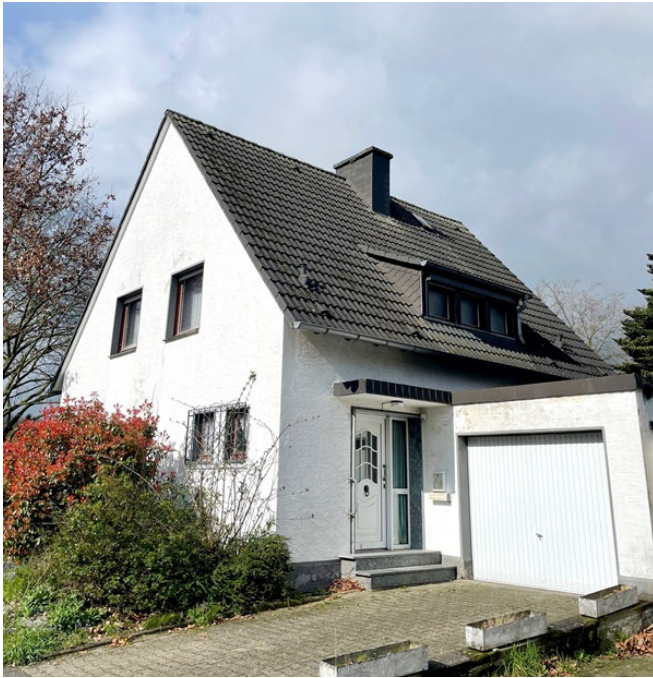
Hausansicht mit Garage