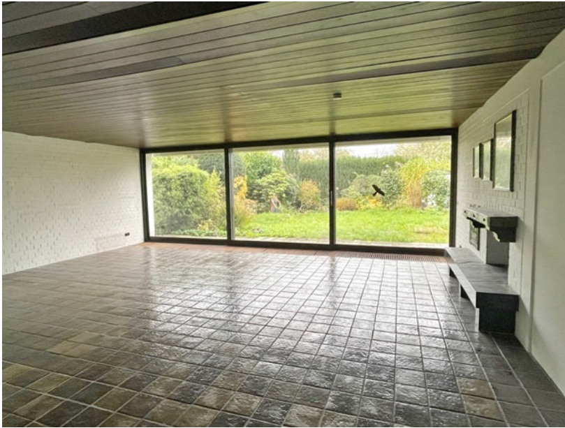
Blick in den Außenbereich