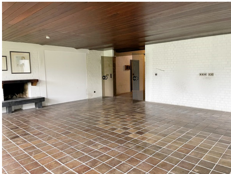
Wohnraum mit offenem Kamin