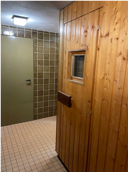
Sauna- u. Duschbereich im Keller