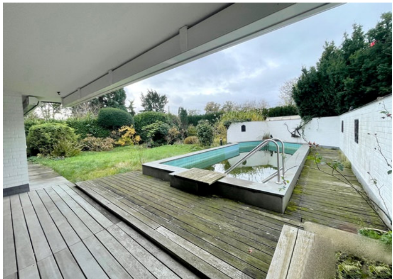
Blick in den Außenbereich