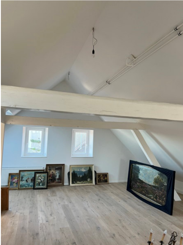
Studio im DG