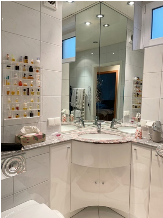
saniertes Bad mit Dusche