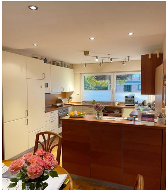
Blick in die Küche