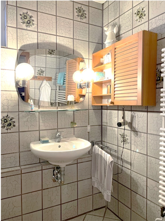
Duschbad im Dachgeschoss