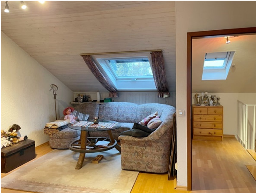
Dachgeschoss (Größe ca. 40 m 2 )