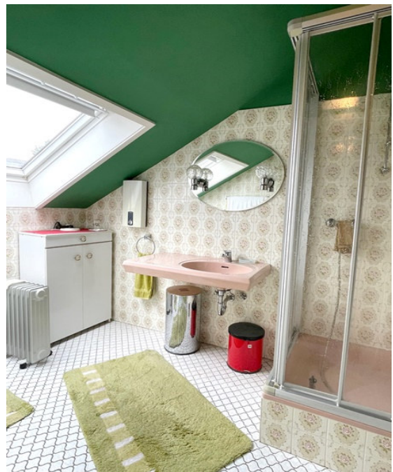
Bad mit Dusche (OG)