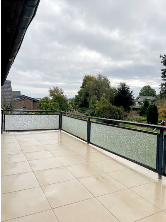
große Terrasse (OG)