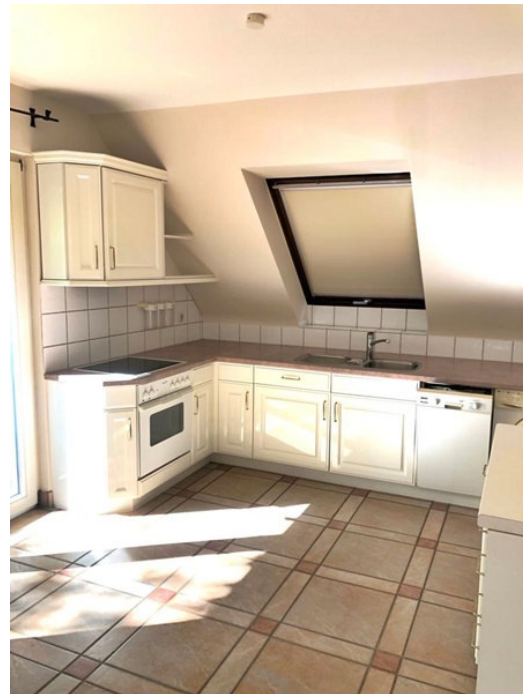
Küche (inkl. Einbauküche)