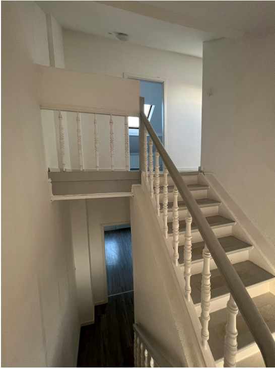
Aufgang ins Dachgeschoss