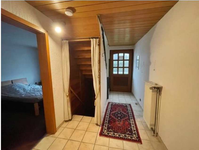
Diele u. Blick ins Schlafzimmer