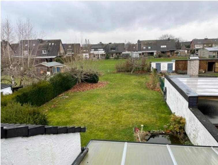
Blick vom OG