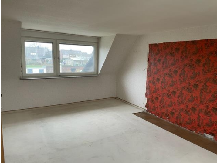
Schlafzimmer im OG