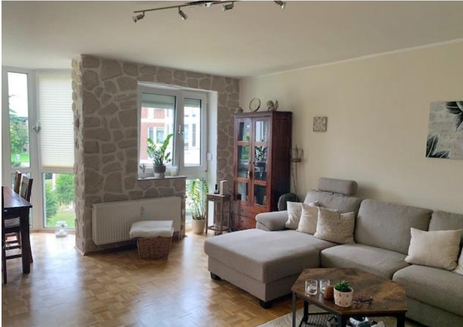
Wohnraum mit Erker