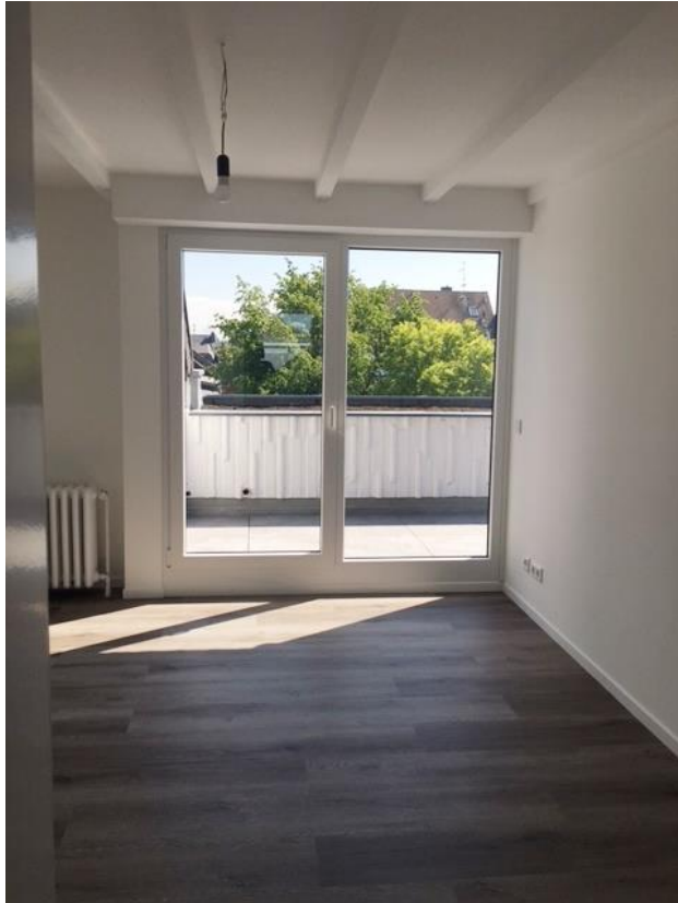
Schlaf- oder Arbeitsraum