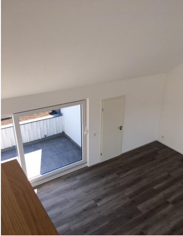
Blick in den Wohnbereich