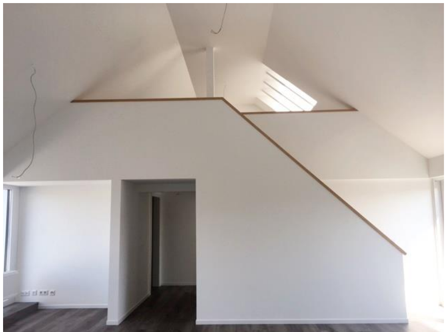
Blick auf Galerie