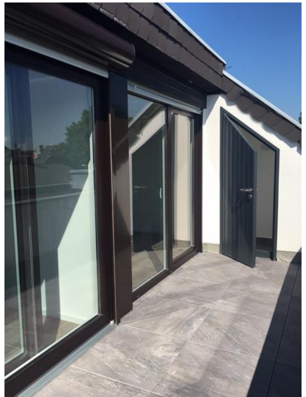
Balkon + Abstellraum