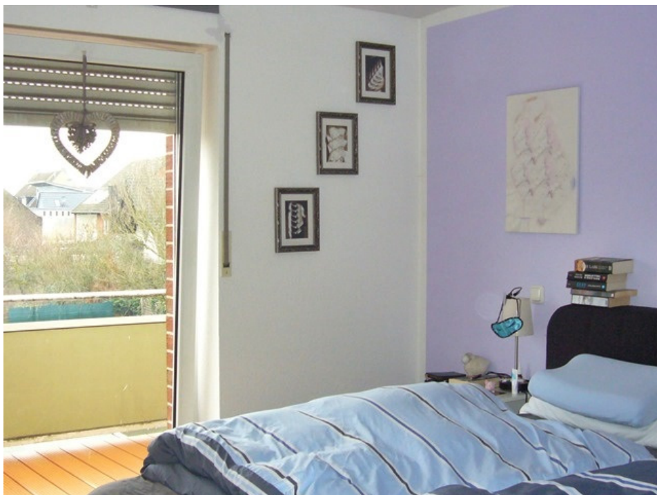
Elternschlafzimmer mit zusätzlichem Balkon