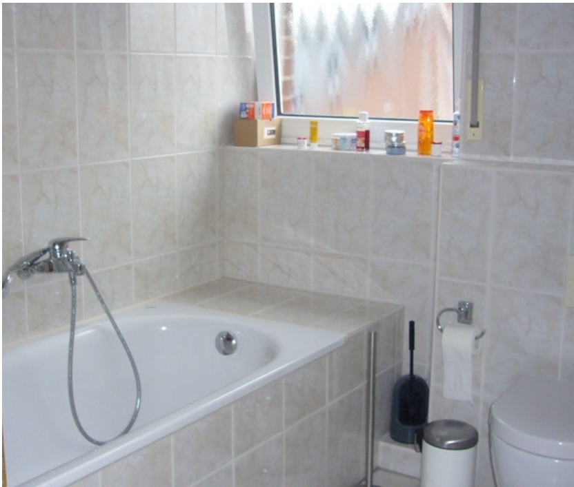
Tageslichtbad mit Wanne u. Dusche