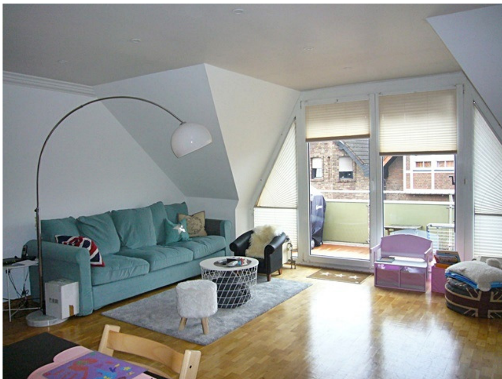
Wohn-/Essbereich mit Südbalkon