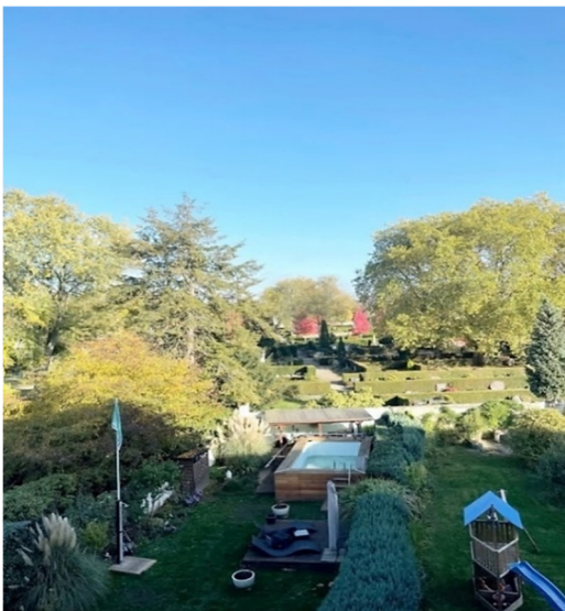
Ausblick in den Garten